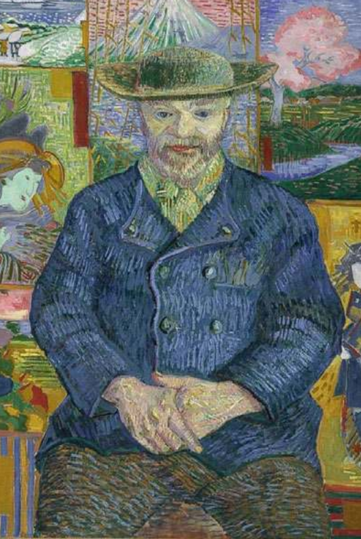
"Portrait of Pere Tanguy" (1887) - Vincent van Gogh