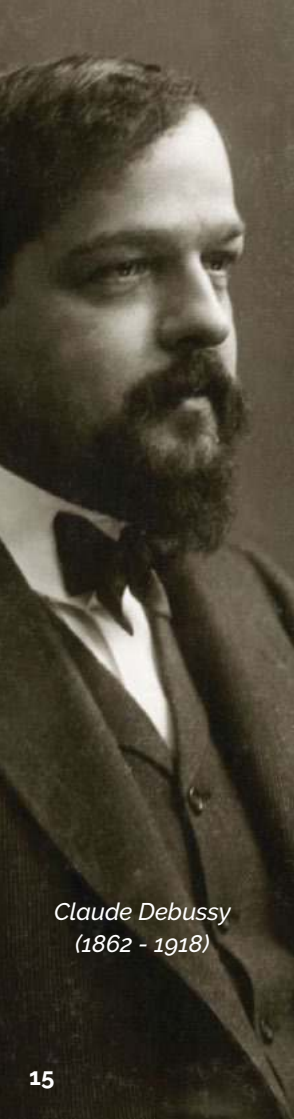
Claude Debussy (1862 - 1918)